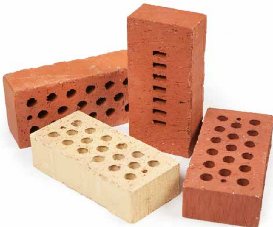
Röd Spånad SNF 19 hål

Övrig tegel- och murverksinfo: se BKR och AMA Hus.