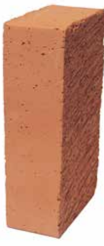
Röd Slät SNF MA