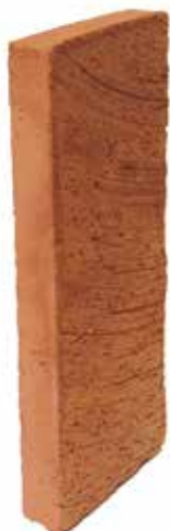
Röd Slät NF 25 MA

Övrig tegel- och murverksinfo: BKR och AMA Hus.