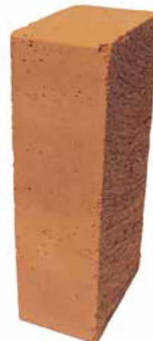
Röd Slät ST 75 MA