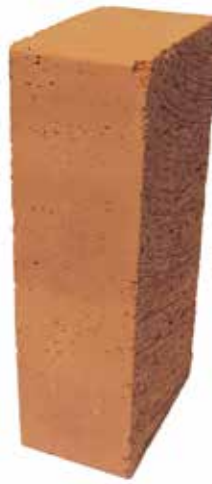
Röd Slät NF 75 MA