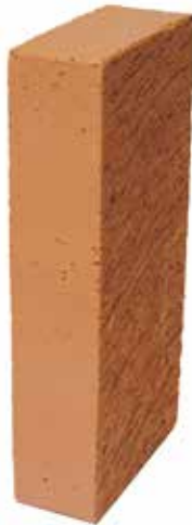
Röd Slät NF 50 MA