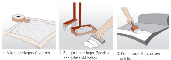
1. Mät underlagets fuktighet.

Gummidukar utan filtklädd baksida måste primas före limning. Stryk ut primern i ett tunt lager på gummidukens baksida. Tänk på att använda en pensel utan metallbeslag och att primern torkar mycket snabbt. Glöm inte att rengöra underlaget noga. Om underlaget är kraftigt sugande eller poröst bör du även prima och spackla innan du limmar. Mät fuktigheten. Ett fuktigt golvunderlag löser nämligen upp limmet, så att duken släpper. Du kan mäta fuktigheten på två sätt: Tejpa plastfolie över golvet. Om golvet är fuktigt bildas fuktpärlor under plasten inom ett dygn. Använd en mätare för relativ fuktighet (RF-mätare). Kontrollera värdet i en fuktighetstabell.