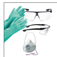
*Skyddshandskar och skyddsglasögon, dammskydd