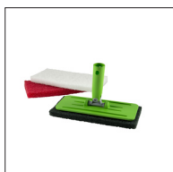
Skurblockshållare + rött skurblock