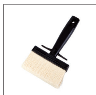
Lutpensel av syntetfiber