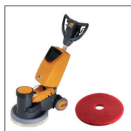
Golvmaskin + röd rondell